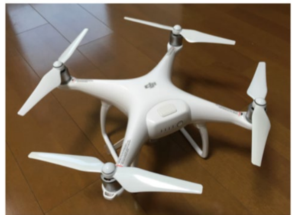
図2 Phantom4 外観