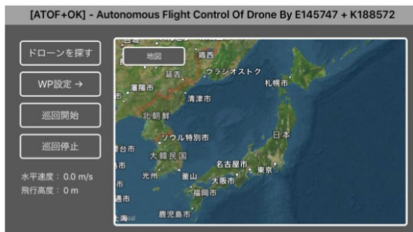
図7 アプリケーション画面