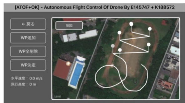
図8 アプリケーションにおける経路作成